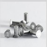
Болты, винты, гайки, шайбы, саморезы, лепестки. ГОСТ, DIN, ISO