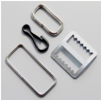
Пряжки, рамки, кольца