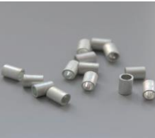
Пломбы трубчатые ГОСТ 18677-73